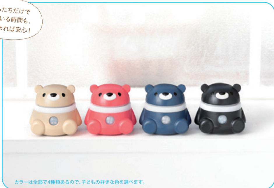
カラーは全部で4種類あるので、子どもの好きな色を選べます。

4,500円+税 ※この商品は、WiFiのインターネット環境(2.4GHzの周波数帯域のみ)で動作します。ご利用場所のインターネット環境を確認の上、お買い求めください。